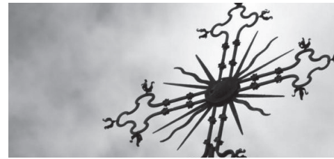
Tėsinys. Pradžia - praejusio sekmadienio laikraštelyje

Popiežius Pranciškus savo žinioje primena apaštalo Pauliaus išpėjimą: „Visų blogybių šaknis yra godulystė“ (1 Tim 6,10). Pinigas gali užvaldyti žmogų, tapti stabu. Vietoj buvęs įrankiu, kuriuo naudojames darydami gera ir liudydami solidarumą su kitais žmonėmis, pinigas gali mus ir visą pasaulį pajungti egoizmo logikai, kurioje nelieka vietos meilei ir kuri kenkia taikai. Palyginime matome, kad meilė pinigui ir godumas kursto tuštybę. Turtuolis rūpinasi savo išore, puikuojuosi prieš kitus tu, ko kiti negali sau leisti. Tačiau iš tiesų jis šitaip tik dangsto savo vidinę tuštumą. Jo gyvenimas tai tik rūpinimasis išore, tik tuo kas paviršutiniška ir neesminga. Dar žemesnis sugedimo laiptelis yra išdidumas. Turtuolis dėvi prabangius rūbus, tarsi būtų karalius, jo laikysena – kaip dievybės, nors iš tiesų jis yra paprastas mirtingasis. Matydami šį veikėją, – sakė popiežius, – suprantame, kodėl Evangelija taip kategoriškai smerkia meilę pinigui.